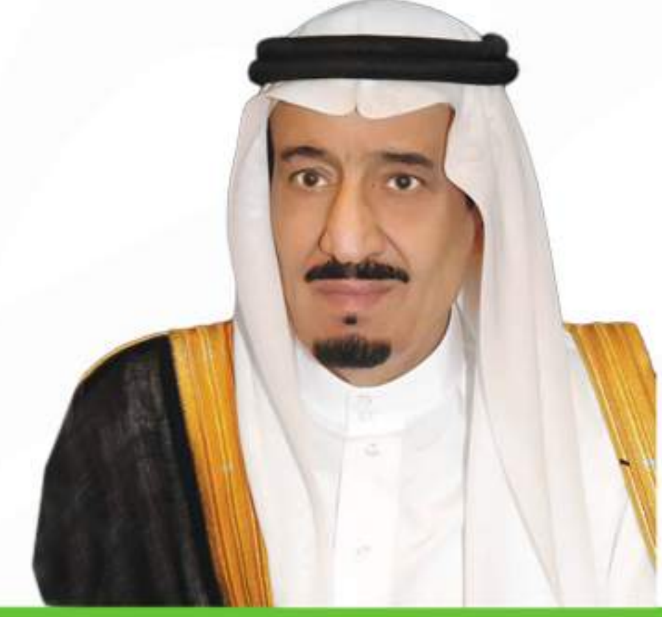
خادم الحرمين الشريفين

ديننا الإسلامي الحنيف دين متكامل وتعاضد وتأزر وشريعتنا الإسلامية تؤكد على العمل الخيري.