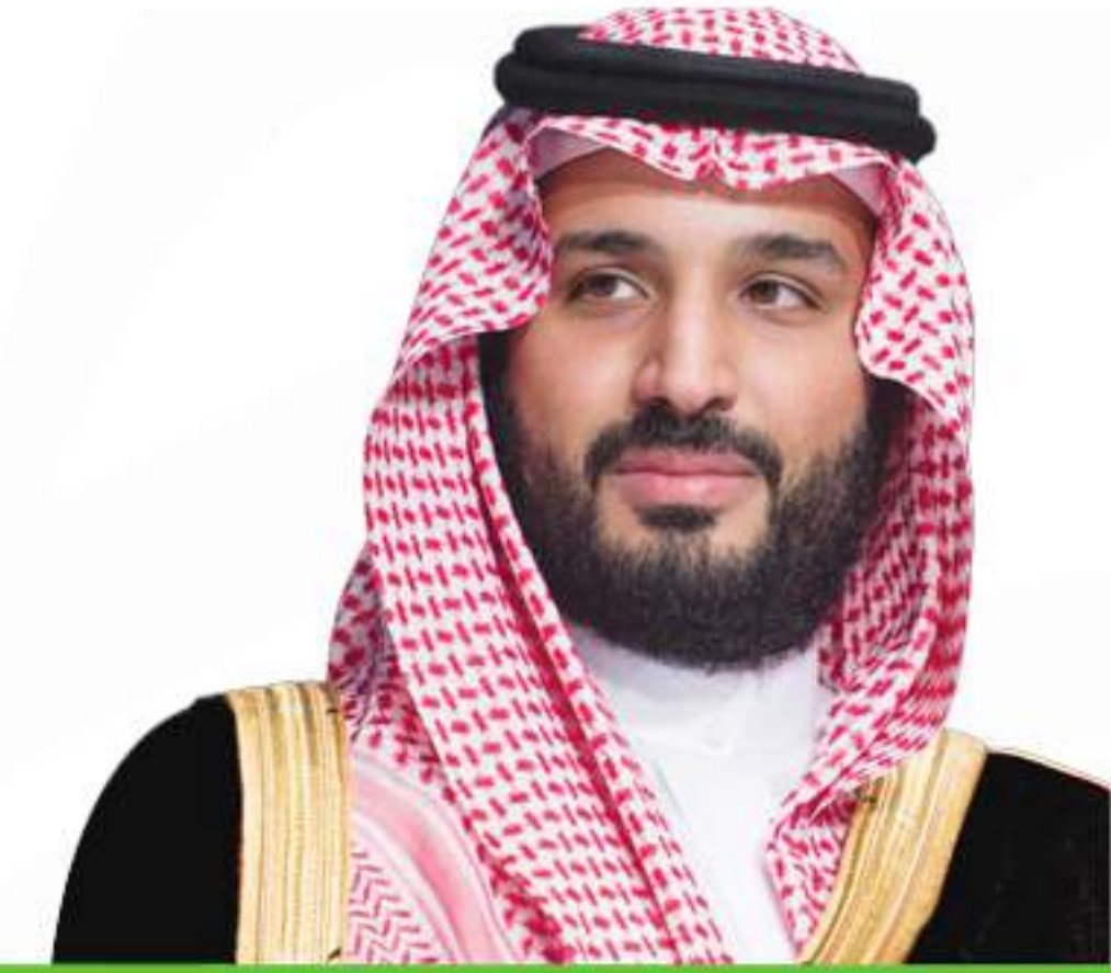
صاحب السمو الملكي الأمير